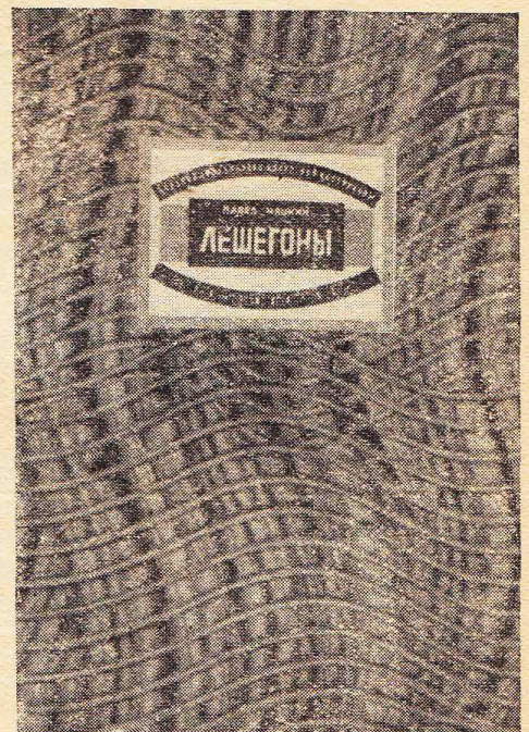
Обложка худ. И. Рерберга

● Род. Акульшин применяет интересный прием построения колхозной повести — « Повесть об одном колхозе » — из ряда тематически различных очерков. Очерки связывает в единое социальное целое — судьба одного «героя», бывшего батрака. Конечно, это не строго продуманная и сюжетно-скрепленная повесть. В ней нет строгой последовательности в событиях, в ней каждый очерк приносит и новых «героев» (кроме одного — как бы скрепляющего все очерки вместе), но зато в повести Акульшина есть строго последовательная сюжетная линия — борьба за колхоз.