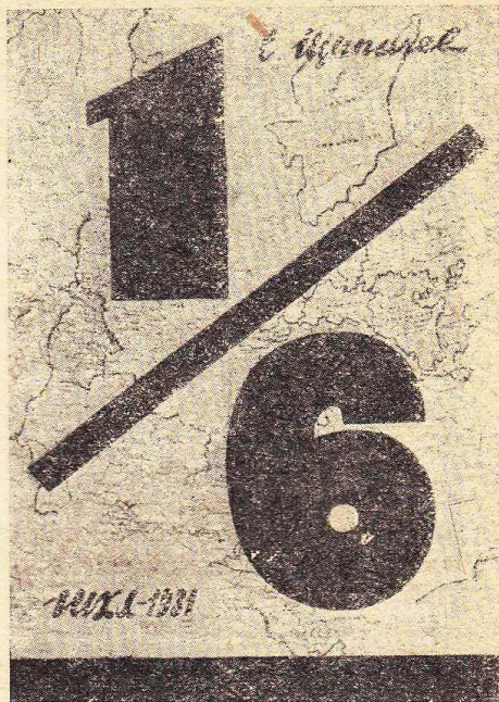
Обложка худ. К. Зотова

«Повесть, — говорит автор в своем предисловии, — если можно так выразиться, «бурно-пламенная». Люди, действующие в ней, — люди, жадные до жизни, с горячей красной кровью. В повести любят, ненавидят, кто-то злобно тянется к предательству... Жарко и сумбурно шепчет листва, грохочет гром, рушится ливень — июльский, июльский, июльский!