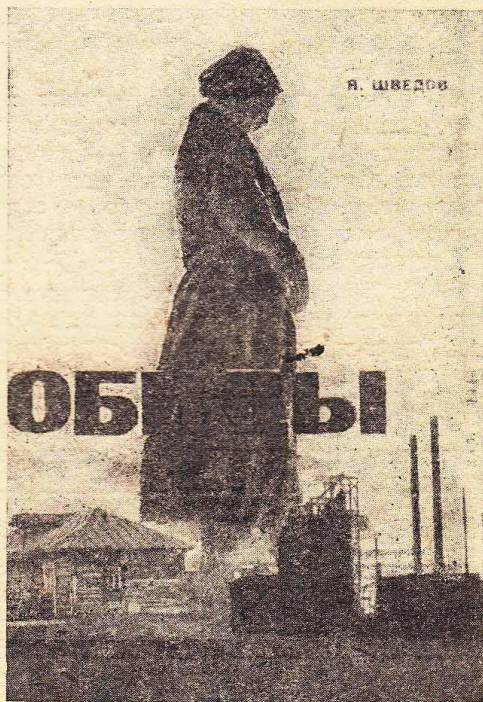
Обложка худ. Дружкова и Межбарга